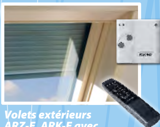
Volets extérieurs ARZ-E, ARK-E avec interrupteur ou commande