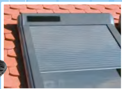
Volets ARZ Solar alimenté avec les piles solaires avec commande